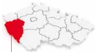
Die Region Pilsen in Tschechien

In October 2015 LOXXESS was awarded 3rd place at the 12th THE TIGERS of CZECH REPUBLIC awards in Pilsen. The prize is awarded to fast-growing companies and firms with good growth prospects and is open to companies with yearly revenues of more than 10 million euros.