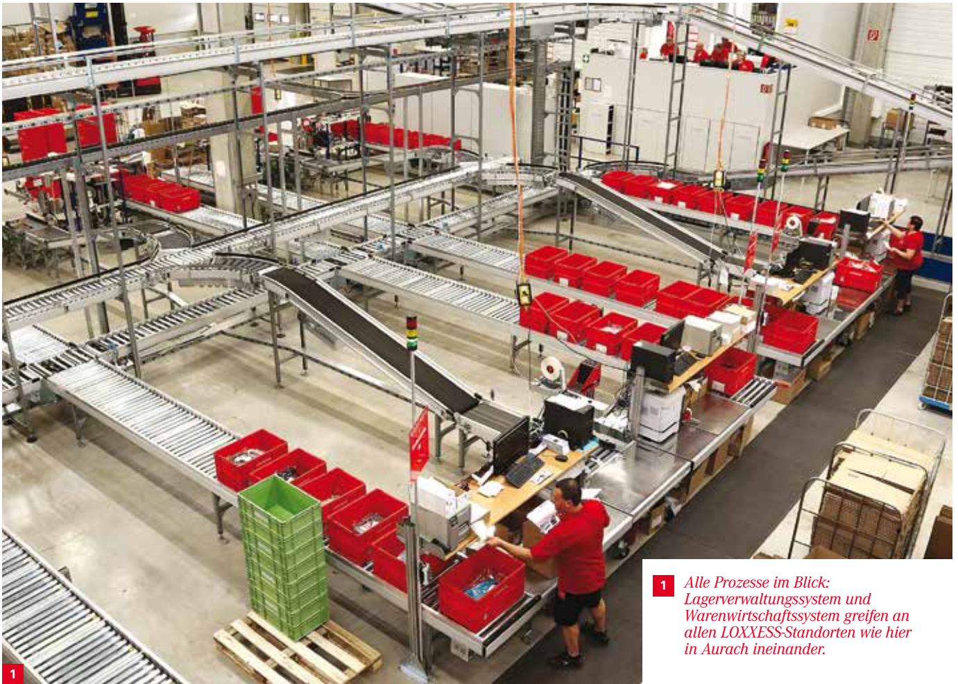
1 Alle Prozesse im Blick: Lagerverwaltungssystem und Warenwirtschaftssystem greifen an allen LOXXESS-Standorten wie hier in Aurach ineinander.

Abwicklung des Zahlungsverkehrs per Kreditkarte oder andere Zahlarten einbinden. Scoring-Systeme können im Hintergrund die Bonität des Bestellers prüfen etc. Die Implementierung eines Neukunden dauert dabei zwischen zwei und vier Monaten. „Auch hier sind wir mit unserem eigenen IT-Team mittelständisch flexibel und schnell“, betont IT-Leiter Breusch.