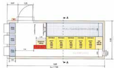
3 Skizze des Rechenzentrums