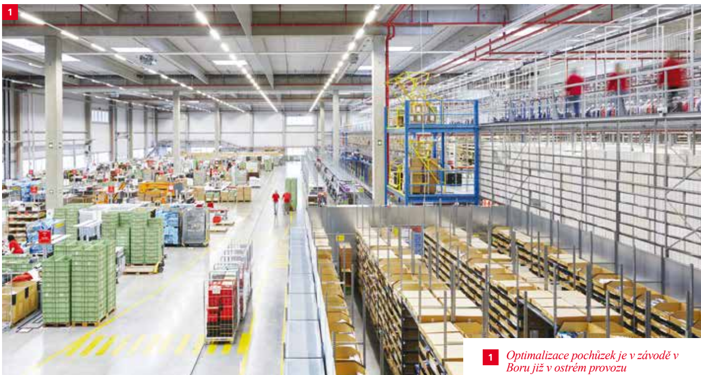
1 Optimalizace pochůzek je v závodě v Boru již v ostrém provozu