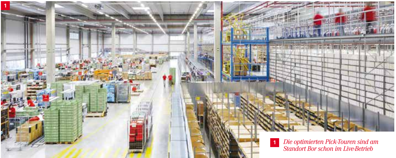
1 Die optimierten Pick-Touren sind am Standort Bor schon im Live-Betrieb

diese Möglichkeiten auszuschöpfen. Deshalb ist dies für uns ein Einstieg in eine neue Ära, die von Big Data, Automatisierung und Robotik geprägt sein wird. Die nächsten Stufen mit Heureka sind schon vereinbart, auch in Aurach, unserem zweiten E-Commerce-Standort, werden wir mit LOS arbeiten. In Zukunft kommen bei LOXXESS zwei Faktoren zusammen: Unsere praktische Erfahrung und die Analysefähigkeit. Beide zusammen werden uns und unseren Kunden viele Erfolgsgeschichten bringen!